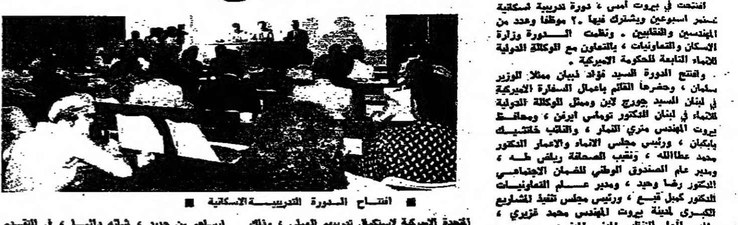
افتتاح الدورة التدريبية الاسكانية

افتتح في بيروت أمس دورة تدريبية اسكانية حضرها المهندسين والفنيين، وتبنتها وزارة الإسكان بالتعاون مع الوكالة الدولية للإسكان التابعة للحكومة اللبنانية.